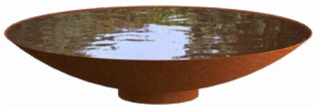
WATER BOWL CORTEN

Úplný přehled všech našich produktů a specifikací naleznete na www.adezz.com