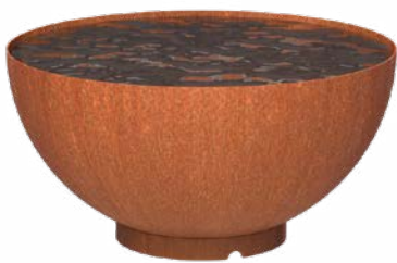
WATER BOWL BOCCA